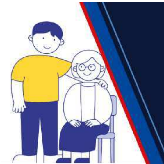
Péče o druhou osobu