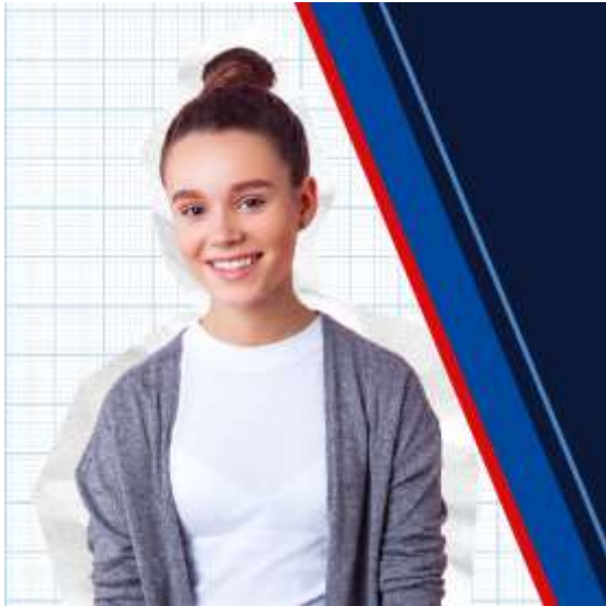
Kurz pro školní mládež