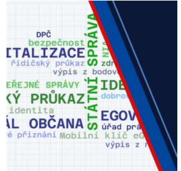
Metodiky a pracovní listy pro vzdělavatele