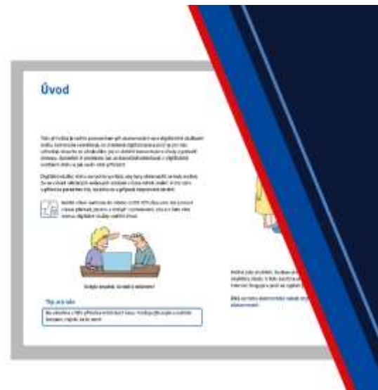
Kurzy a tištěné materiály