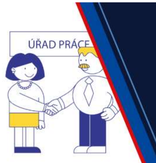
Co dělat v nezaměstnanosti