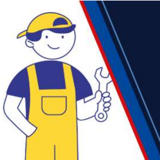
Jak začít podnikat jako OSVČ