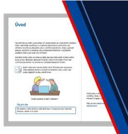
Brožura pro seniory