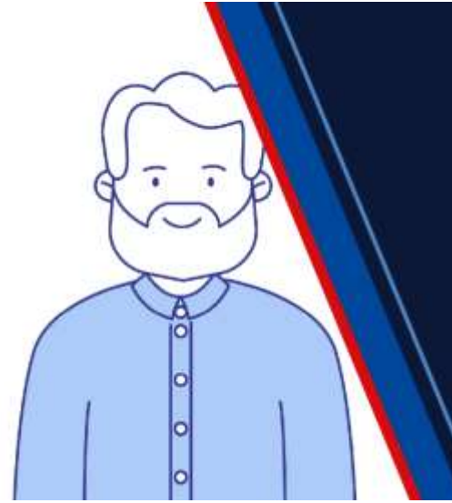
Přechod do starobního důchodu