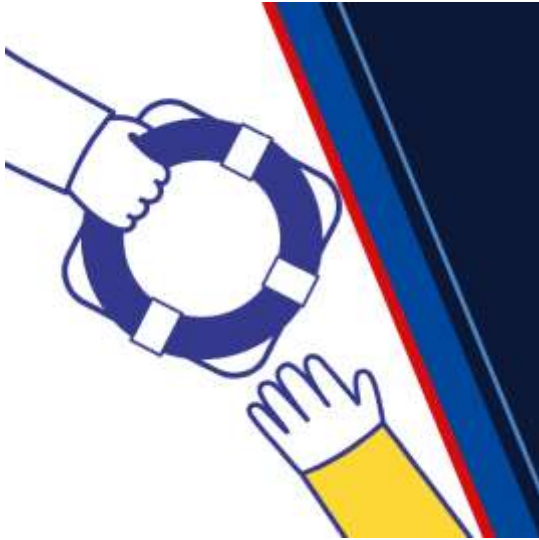
Jak řešit dluhy a vstoupit do oddlužení