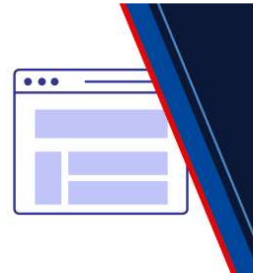
Portál občana nanečisto