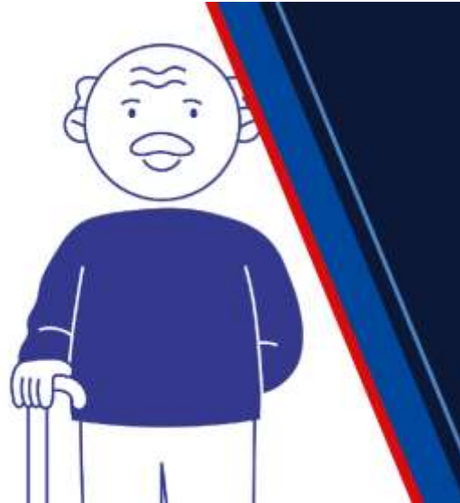
Kurz pro seniory