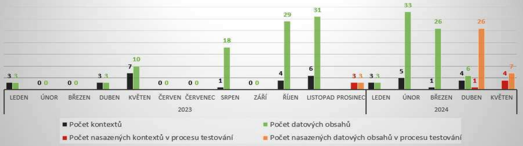
Kontexty a datové obsahy v TEST ISSS