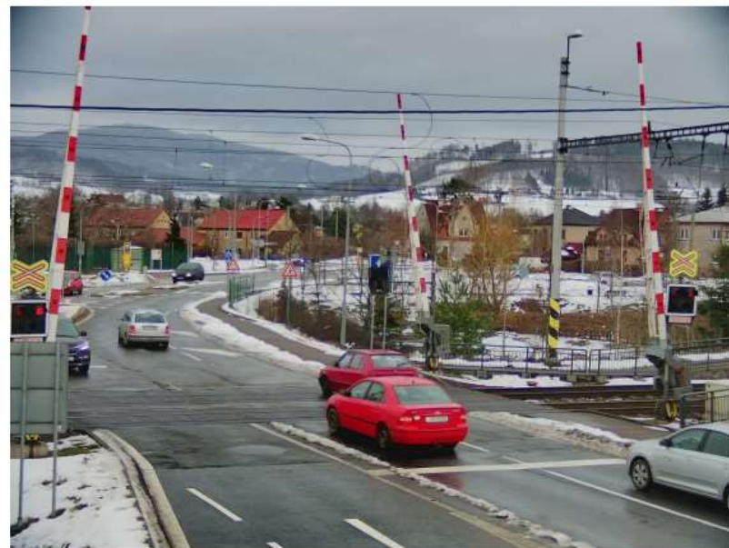
02.02.2023 v 09:35:47 | 1. Detail RZ | P828