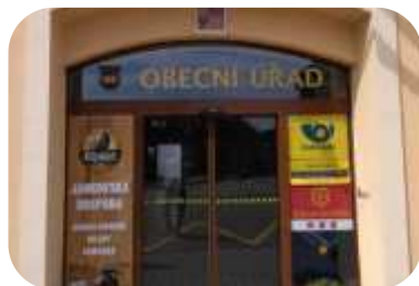
Městské a obecní úřady (i další OVM)