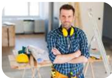
Živnostníci (podnikající fyzická osoba)