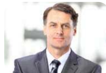
Advokáti, exekutoři, daňoví poradci, auditoři, insolvenční správci, atd.