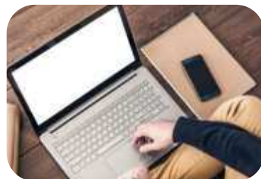
Malé a středně velké firmy, které nemají silné IT