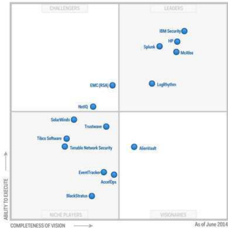
Figure 1. Magic Quadrant for Security Information and Event Management