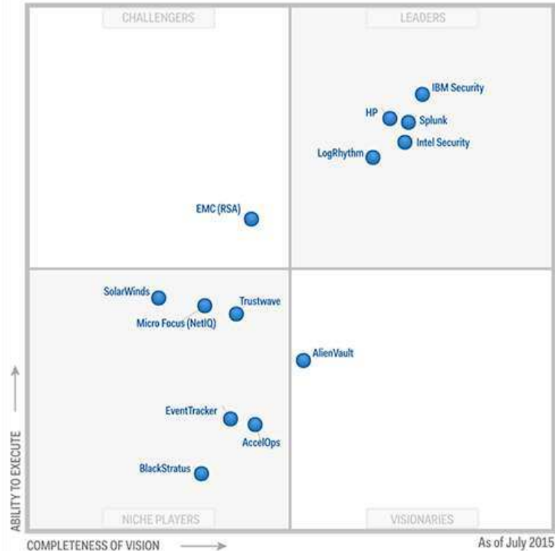
Figure 1. Magic Quadrant for Security Information and Event Management