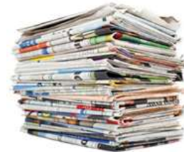
Důvěra v informace