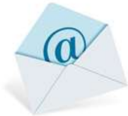
Přístup k e-mailu...