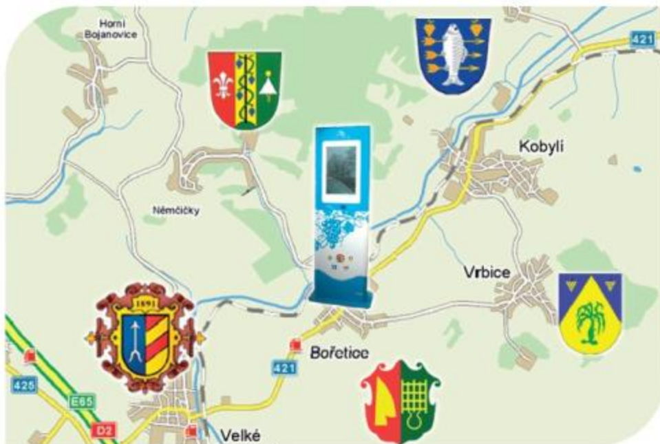
Mikroregion svazku obcí Modré Hory.