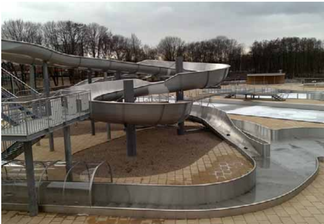
Nové koupaliště, Hradec Králové