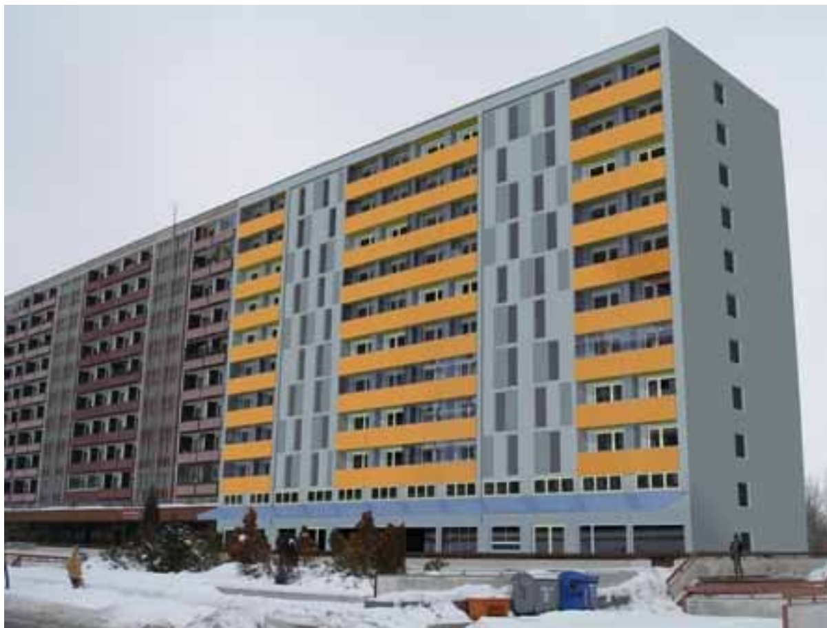
Vizualizace revitalizace tř. E. Beneše, Hr. Králové (IPRM, hrazeno v rámci prioritní osy 5.2 IOP)