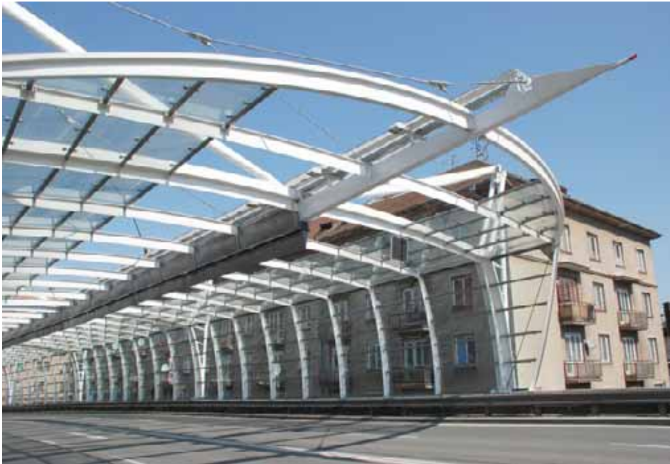
I/31 ul. Okružní, Hradec Králové, protihluková stěna